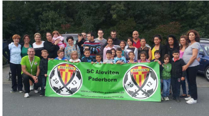
August Ausflug in den Safaripark