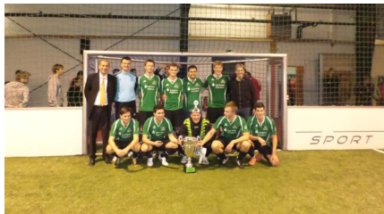
Dezember 1. Weihnachtscup Gewinner: SJC Hövelriege