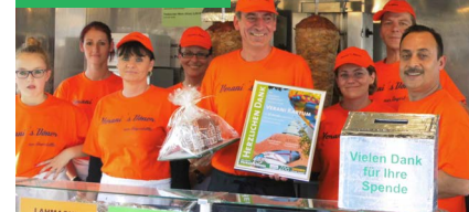
Dezember Teilnahme in der Ehrenamts- hütte auf dem Weihnachts- markt Paderborn