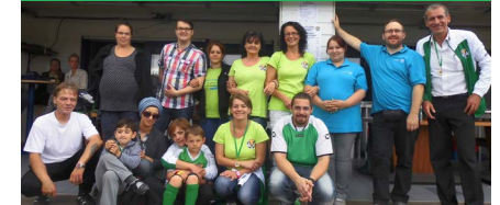
April Integrationsfest auf dem Monte Scherbelino