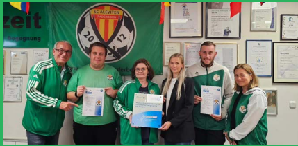
Juli 2025 Zertifikatsübergabe Qualitätsbündnis LSB